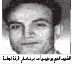
شيهيد العربي بن مهيدي أحد أبرز مناضلي الحركة الوطنية

لتكون المقاومة السليسية أكثر من ضرورة وعملت فصلتها المختلفة على القيام بواجبها بالطرق والأساليب والابتكارات المتوفرة كل حسب قدرته، وبهذا فإن الحركة الوطنية بصورة دقيقة كانت تتعدت أن الفرنسيين مجرد محتلين ما هم إلا مجرد أمثال للإسلام الرومان والوندال والبيزنطيين، بل وكأ أن اثنين من جزائريين وتحديدهم من استبداد الثعالبين كما أشاعوا عند دخولهم أرض الجزائر وإنما لاستبعادهم واستيلاحة أعراضهم وثرواتهم، كما عير الفرنسيون أنفسهم من هذا الموقف كما جاء في رسالة ليون روش إلى الأمير عبد القادر بقوله: